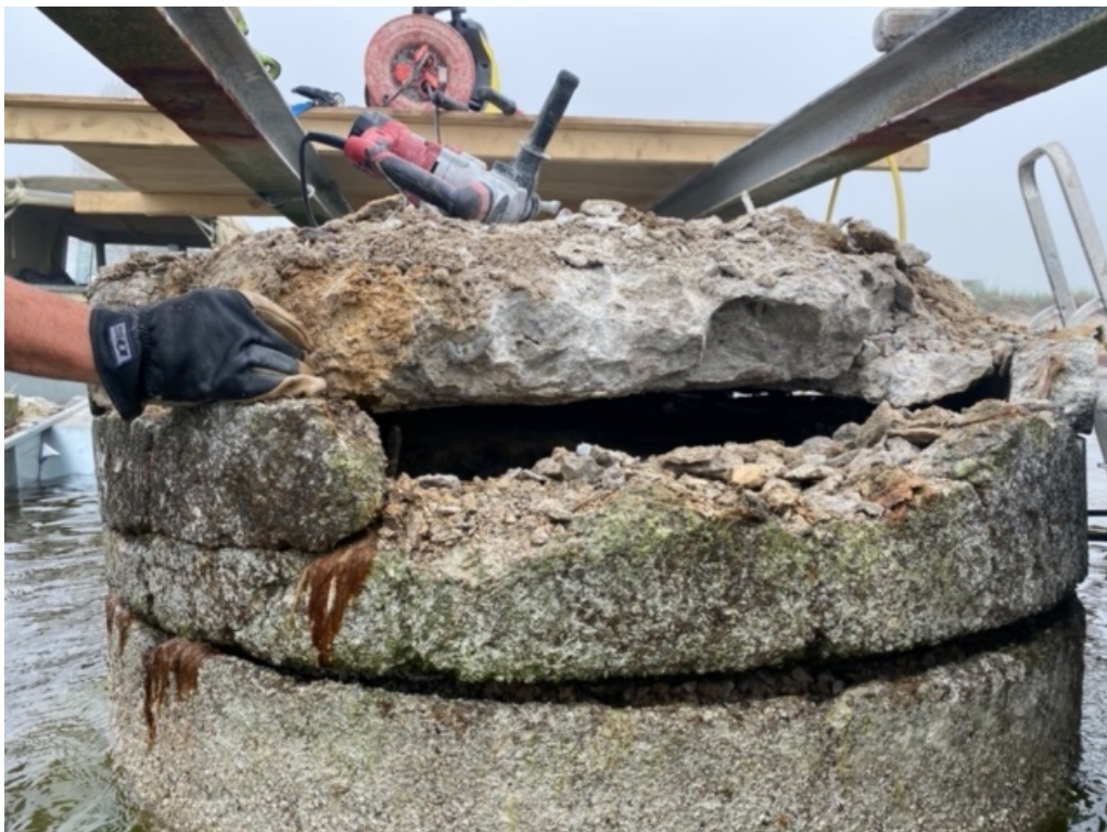
Foto nr. 10 Stöd: 3 Demontering och bilning av bristfällig betong och armeringsstål.