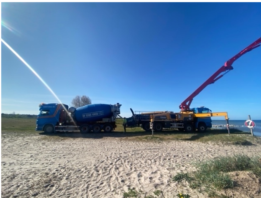
Foto nr. 1 Betong- och Pumpbil placerade ovanför strandkant på något stabilare mark.