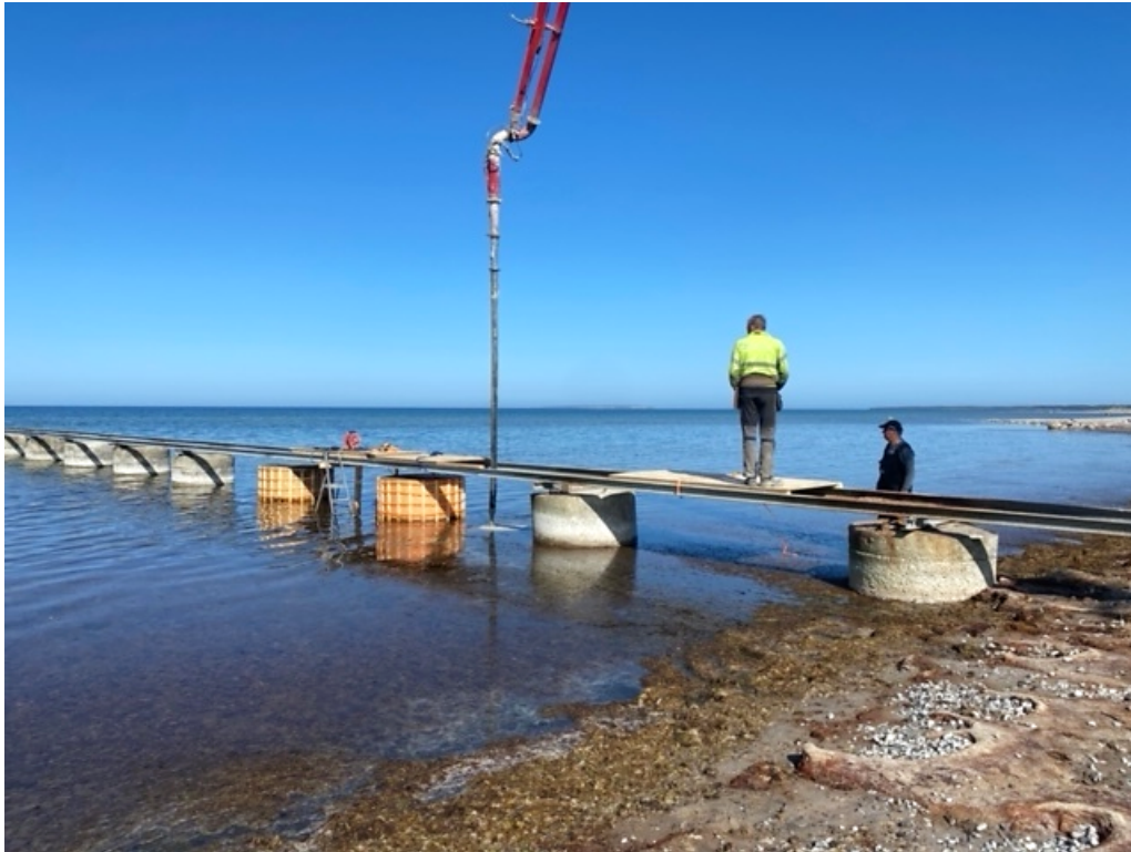
Foto nr. 9 Översiktsfoto – Betongpumpbil med utfälld arm vid aktuella stöd.